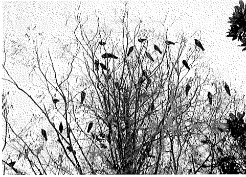
越谷市久伊豆神社の鳩 (20:00) (山部直喜)