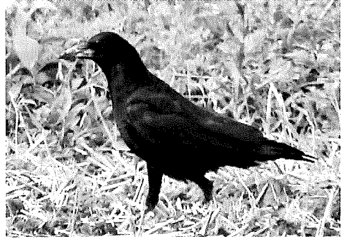
ミヤマガラス (編集部)

オナガは1970年代から1980年代にかけて県平野部で繁殖、普通に見られる鳥 (小荷田ほか1993) になった。1990年代勢力を増したハシブトガラスによる繁殖妨害が多発し、浦和区の住宅地で繁殖期は見られず (小荷田2003)、オナガはじり貧となっている。ハシブトガラスの攻撃から守るためか、ツミの巣近くにオ