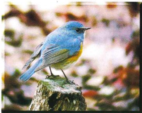
ルリビタキ (小林ますみ)