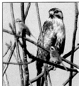
ノスリとホオジロ(本橋紳治)

見どころ: 長倉神社でレンジャク類を、塩壺温泉までの別荘地でケラ類、カラ類を、野鳥の森近辺では赤い鳥を探しましょう。雪対策を十分に。昼食は恒例塩壺温泉ホテルで、各自お願いします。