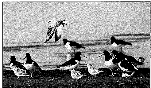
ミヤコドリとダイゼン (松村禎夫)