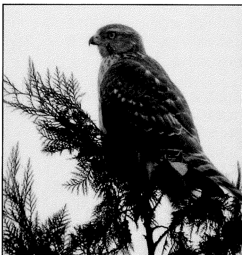
オオタカ幼鳥(大澤祐)

見どころ：雷とともに梅雨が明け、雷とともに夏が終わるといわれています。立秋とはいえ残暑の厳しい時季です。木陰が多いので、幾分かはしのぎやすいと思います。水と緑の効用を心に刻みながら、広く自然に目を向けて観察するよい機会ともいえます。