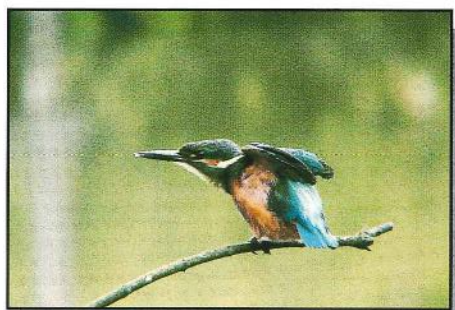
カワセミ (編飼喜雄)