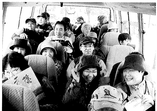
いざ戸隠飯綱高原へ!