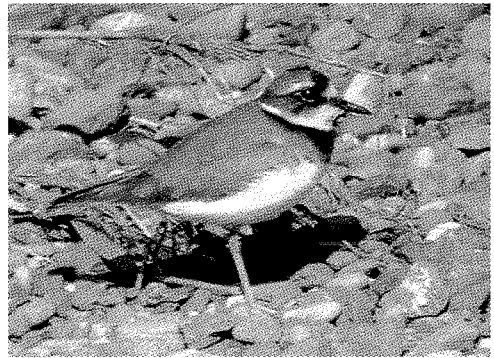
イカルチドリ（久保田忠資）

♂1羽。冠羽が広がってとてもきれい。今 年はヤマガラがかなり多く、静かにしてい るとすぐ傍まで寄ってくる。ジョウビタキ の♂がモズに追い回されていたが、ジョウ ビタキの数はまだ少ない。クロジ、ルリビ タキの情報があるが確認できず。11月3日、 ミソサザイ1羽。この時期は落ち着きがな く、ゆっくり観察できない。クロジ♂1羽、 アオジとの喧嘩に負けて藪を追い出された。 他にシメ、カシラダカなど（長谷川訓寿）。